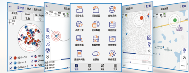
星空图 道路放样 扁平化UI界面 DTM面放样 在线地图