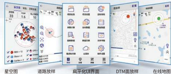
星空图 道路放样 扁平化UI界面 DTM面放样 在线地图